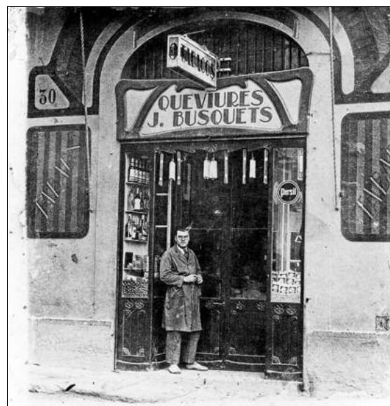
El fundador, davant la botiga en una imatge d'època

dem ser molt més competitius en el preu».