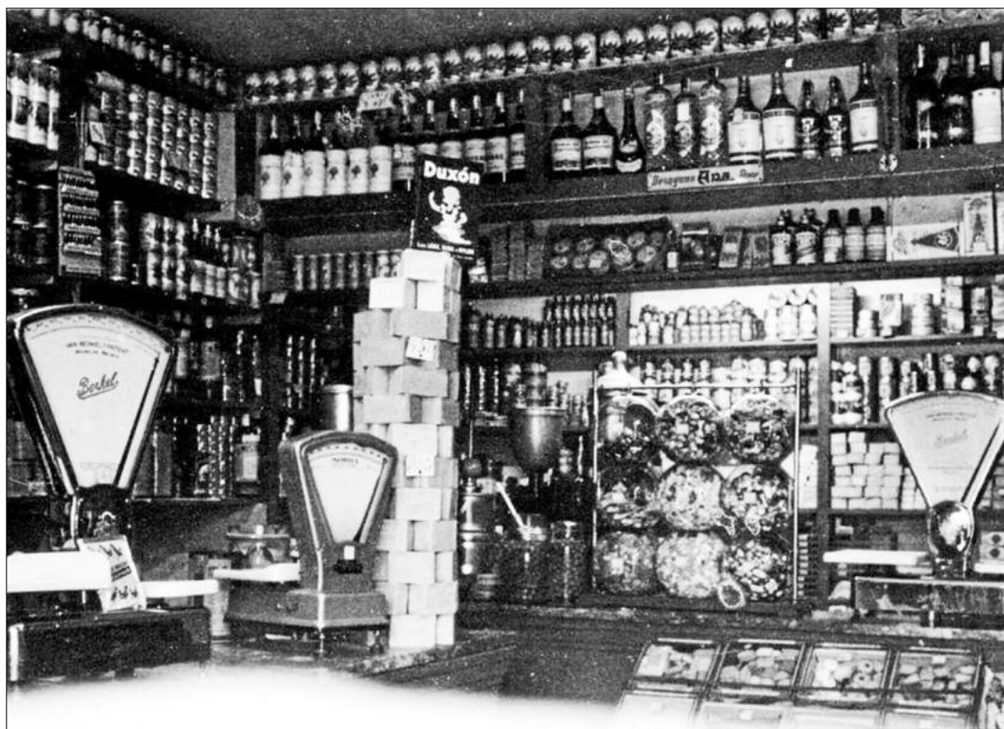
L'interior de l'establiment en una fotografia històrica