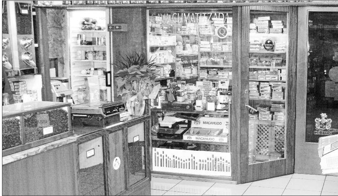
Vista actual de l'establiment, a la carretera de Vic de Manresa